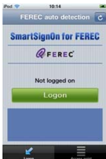
ワンタッチ・ログオン画面