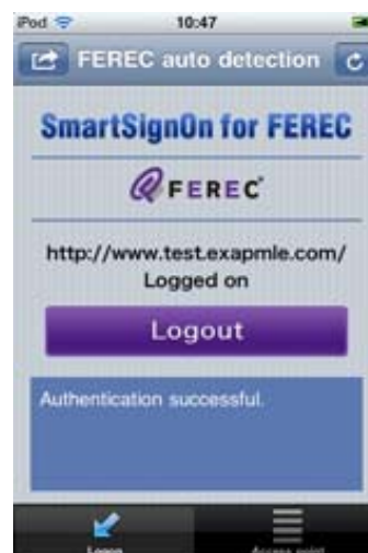
ワンタッチ・ログオフ画面