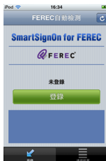
ワンタッチ・ログオン画面(繁体)