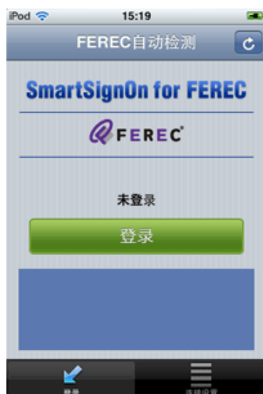
ワンタッチ・ログオン画面(簡体)

URL:http://itunes.apple.com/jp/app/smartsignon-for-ferec/id382525299?mt=8